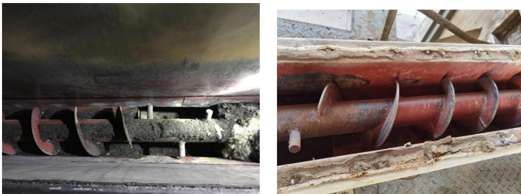
图5 左分选机排料螺旋

检查左分选机进料螺旋和上下腔排料螺旋时，发现螺旋叶片有变形并与外壳均有异常磨损的痕迹，同时查出干燥旋风除尘器锁气卸料阀腔体锈蚀掉皮，分选系统内部进入铁质异物。分选系统设备转动部件和系统内的高温阴燃物料经过摩擦、挤压发热产生火星，系统火花报警仪连续报警，当班生产负责人没有责令及时停机处理，最终引发了左右分选机及废料间内的粉尘云燃爆。